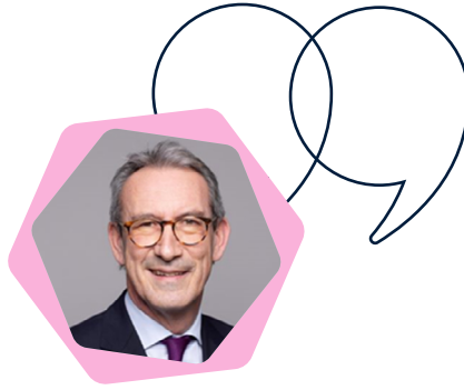
ARNAUD BAZIRE, DIRECTEUR GÉNÉRAL DE SUEZ EAU FRANCE

► « Les villes ont devant elles et dans un horizon proche le double défi de devenir intelligentes et durables. À la fois pour offrir aux citoyens un cadre de vie plus écologique, mais aussi pour aider ces derniers à devenir des acteurs du changement en leur offrant des solutions et des infrastructures efficaces sur le plan énergétique et respectueuses de la biodiversité. Cette double ambition peut se synchroniser à travers l'usage des technologies digitales, comme l'intelligence artificielle, l'internet des objets ou les jumeaux numériques, car elles offrent un levier puissant pour accélérer et piloter la résilience et la sobriété. »