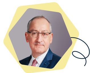
PHILIPPE MAILLARD, CEO OF APAVE GROUP

► "SCC is proud to be part of this new collaboration framework 'Territoires de demain' initiated by UGAP, an innovative partnership that brings together the essential skills to successfully drive the digital transition for local authorities. As the 2 nd largest IT services company in France, with €2.7 billion in revenue and over 2,500 employees nationwide, SCC is committed to providing its technological and industrial expertise to support local authorities in the digital transformation of their territories. Our teams, present in 14 offices across France, are determined to provide cutting-edge integration and maintenance solutions, addressing the complex challenges of managing digital infrastructure and services. Collaborating closely with our partners, we have the opportunity to actively contribute to the creation of sustainable and smart territories, an exciting challenge that SCC embraces passionately and aligns with its proximity-focused DNA."